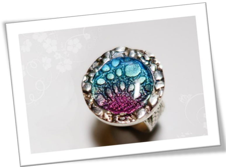
Zilverklei ring met de 3D techniek

Neem een stukje polimeerklei en kneed deze goed door zodat hij soepel en flexibel is en maak hier een bolletje van en druk deze plat in de sieraadkast.